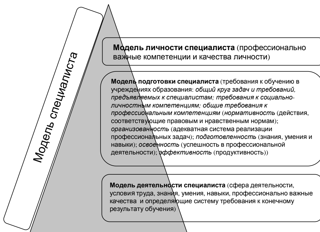
Рис. 1. Структурные компоненты модели специалиста

Ведущими компонентами в разработке структуры модели специалиста являются профессиографические и психографические исследования, которые представляют собой технологию изучения требований, предъявляемых профессией к личностным качествам, способностям и возможностям человека [3; 7].