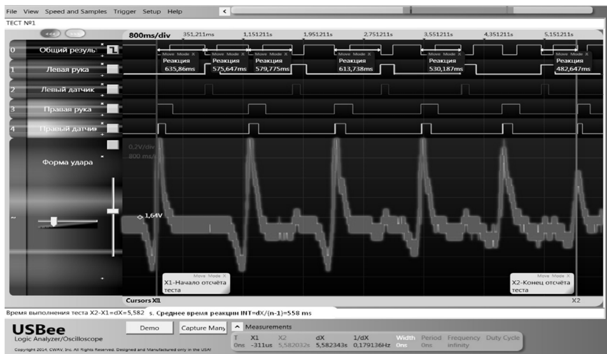
Рисунок 3 – Общий вид регистрации ударов на рабочем окне программы

4 – «Правый датчик» – осциллограмма в бинарном виде просчета временных интервалов сигнала, снятого с датчика удара правой руки после дискриминатора, который задает уровень напряжения, определяющий минимальное применимое ускорение (силу удара).