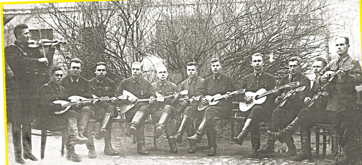
Школа милиции. Гродно. 1940 год

ла Советского Союза Бориса Шапошникова, командующего Западным фронтом Дмитрия Павлова и первого секретаря ЦК КП(б)Б Пантелеймона Пономаренко решили создать полк народного ополчения.