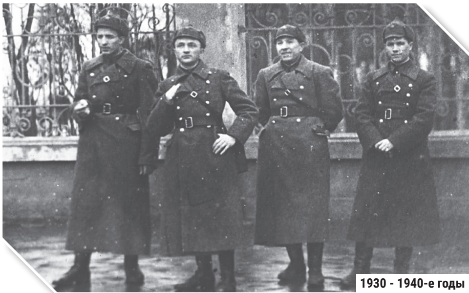
1930 - 1940-е годы