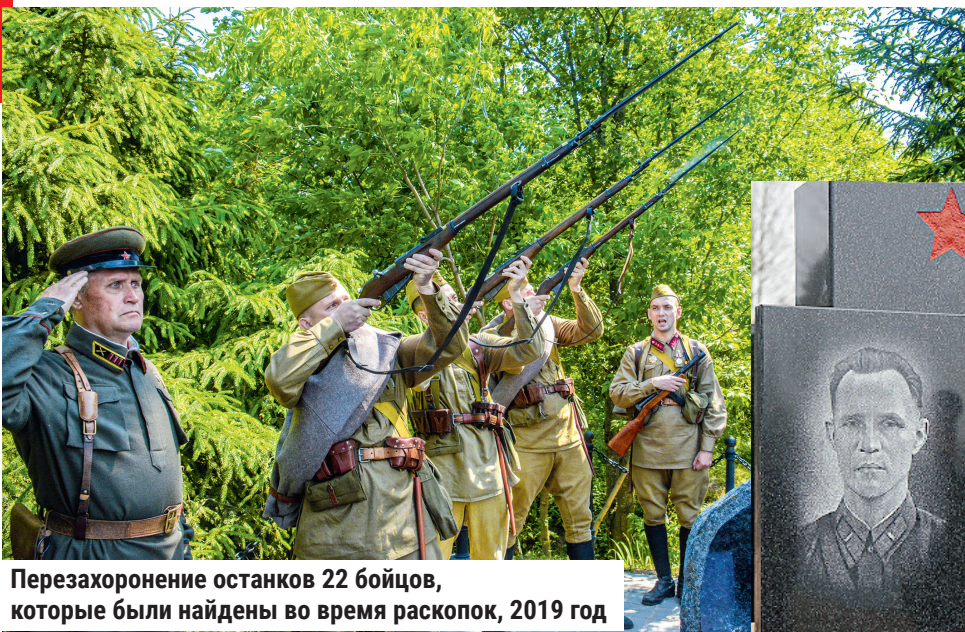
Перезахоронение останков 22 бойцов, которые были найдены во время раскопок, 2019 год